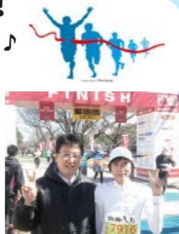
↑熊本市長と記念撮影

2/19(日)熊本城マラソンに参加しました。朝9時、黙祷を捧げてから13000人がスタート。市内を走るコースは、沿道からの声援が途切れず、レース中「がんばれ熊本!」というメッセージをつけて走るランナーや、沿道には「復興支援ありがとう」といった手作りの旗もみられ、終始あたたかい気持ちに包まれた大会でした。