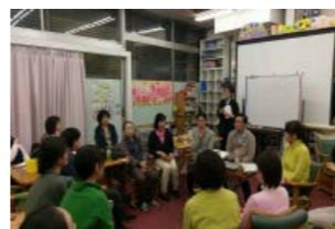
↑オープンダイアログ体験

3月22日NPO学習会にて、精神科医の森川すいめい先生を講師にお招きし、認知症の勉強会を行いました。前半は認知症の方の事例を通し、コスモスハウスおはな、デイサービス、訪問看護の他、他事業所のヘルパーさん、CMさんも来てくださり、それぞれの関わりについて情報を共有し、認知症の方の生活を支えていくための関わりについての理解を深める機会となりました。後半は、森川先生より、脳科学的にみた認知症の症状と対応についてお話いただき、認知症の方の抱える症状や適切な対応について理解が深まる内容でした。また、近年話題になっている、急性期精神病における開かれた対話によるアプローチ「オープンダイアログ」の効果と実際についてお話いただき、盛りだくさんの内容でした。